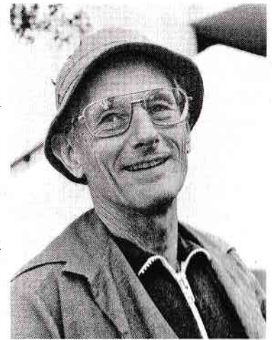
John C. Lilly (1915 - 2001)